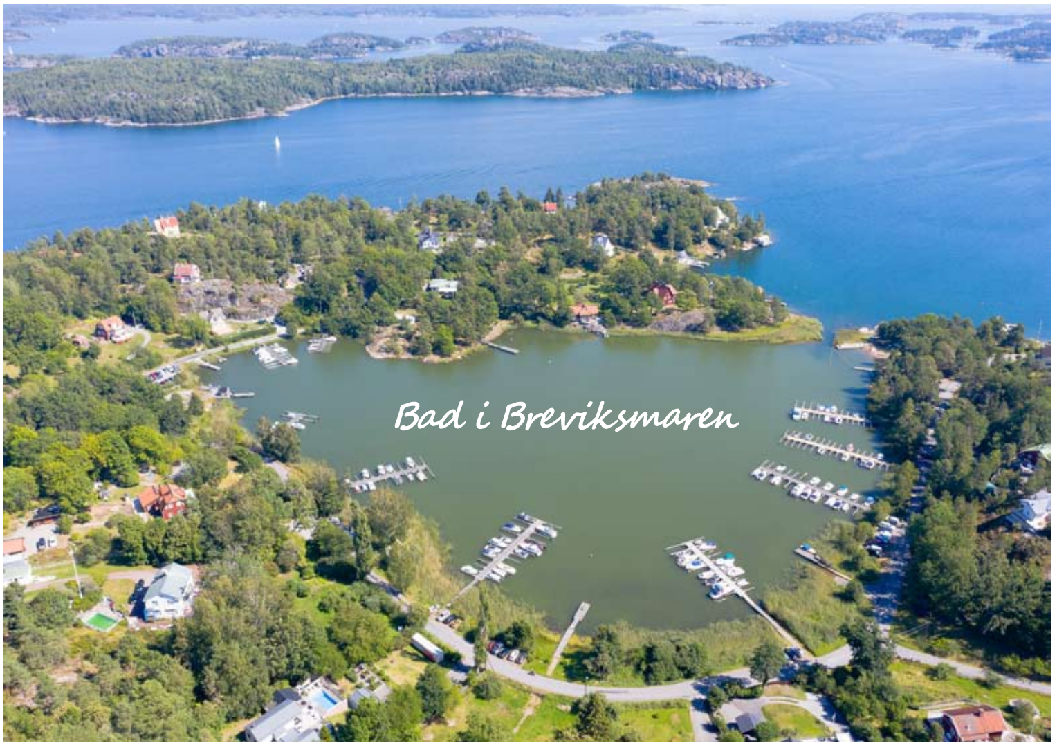
Bad i Breviksmaren